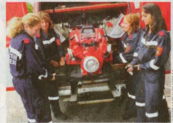
Die Feuerwehr ist keine Männerdomäne mehr

Nachwuchs-sorgen muss sich die Feuerwehr nicht machen: Mehr als 5000 Burschen und Mädchen zwischen 10 und 15 Jahren finden sich in den Mitgliederlisten der 1644 nÖ. Feuerwehren.