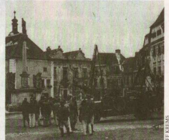
Geschichte: Vorbildwirkung für andere Wehren