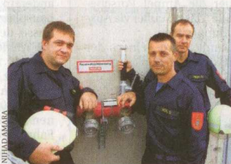
Premiere für die erfahrenen Löschprofs

Weil in den vergangenen Jahren immer mehr schwere Unwetter übers Land zogen, stellte die Feuerwehr in jedem Bezirk eigene Katastropheneinheiten auf die Beine. Die haben sich bereits bestens bewährt. Vor allem beim Hochwasser 2002 stellten diese Einheiten ihre besondere Schlagkraft unter Beweis. Bis zu zwei Wochen waren die Helfer in den Katastrophengebieten im Dauereinsatz.