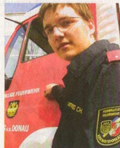
Nachwuchs sichert die Zukunft

Auch fast 150 Jahre nach der Gründung ist Krems ein Vorbild im Feuerwehrwesen. „Wir haben im Jahr rund 900 Einsätze“, sagt Kommandant Schön. Rund 500 Männer und Frauen stellen sich in den Freiwilligendienst. „Auf so einen Betrieb kann man stolz sein“, sagt Schön. Und über die Zukunft müssen sich die Kremser nicht sorgen: Derzeit sind 43 Jugendliche am Sprung in den aktiven Dienst.